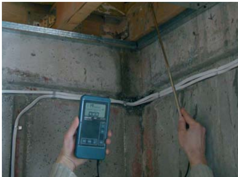
Fot. 6. Poszukiwanie za pomocą anemometru nieszczelności na łączeniu paroizolacji ze ścianą. Przyrząd wykazuje zerowy przepływ powietrza

dzana jest różnicą pomiędzy ciśnieniem zewnętrznym i wewnętrznym. Jeśli różnica ciśnienia nie przekracza 5 Pa, rozpoczyna się druga faza pomiaru. Po zdjęciu płóciennej przesłony uruchamiany jest wentylator. W przypadku wykonywania próby na nadciśnienie rozpoczyna się wtłaczanie powietrza do budynku. W zależności od wielkości nawiewanego strumienia powietrza dobiera się odpowiednie blendy z tworzywa sztucznego ograniczające przepływ powietrza przez wentylator (fot. 4). Zgodnie z normą wykonuje się pomiar wielkości strumienia powietrza przepływającego przez wentylator dla minimum 5 wartości różnicy ciśnienia poniżej i powyżej 50 Pa. Na podstawie uzyskanych wartości zostanie wyliczona zgodnie z normą wielkość przecieku powietrza dla różnicy ciśnienia 50 Pa oraz współczynnik n_{50} . Dla domu w Wólce przeprowadziłem odpowiednio pomiar dla różnicy ciśnienia 70, 65, 60, 55, 50, 45, 40, 35 i 30 Pa, podczas którego otrzymaliśmy wielkości strumienia powietrza od 65 do 112 m 3 /s (rys. 1). Dla każdej wartości różnicy ciśnienia zbierane jest po 100 pomiarów, z których wyliczana jest wartość średnia. Czyli w naszym przypadku, gdzie ciśnienie mierzone było dla 9 wartości różnicy ciśnienia, na ostateczny rezultat składa się 900 pomiarów. Na zakończenie zamyka się otwór wentylatora szczelnie płócienną przesłoną i ponownie, tak jak na początku, sprawdza się różnicę ciśnienia zewnętrznego i wewnętrznego.