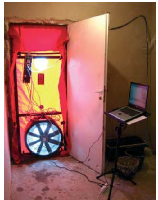
Fot. 3. Urządzenie Blowerdoor gotowe do próby