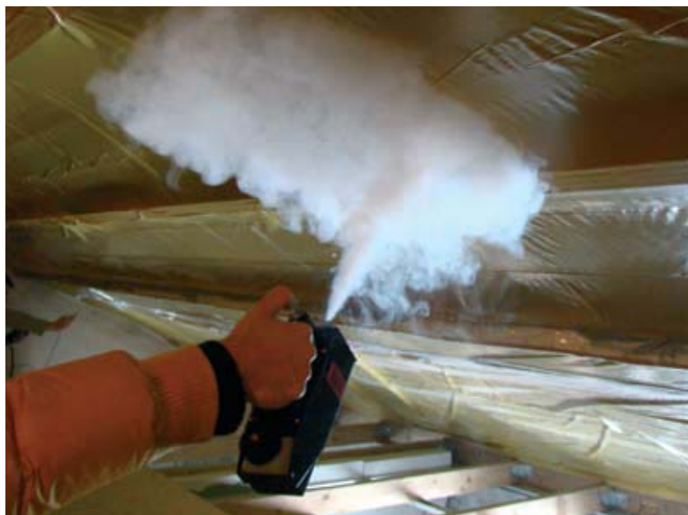
Fot. 5. Sprawdzanie szczelności poddasza za pomocą wytworzycy dymu. Na fotografii widać jak paroizolacja została dociśnięta do termoizolacji podczas próby na nadciśnienie

kie dane jak kubatura netto budynku, prędkość wiatru, temperatura wewnątrz i na zewnątrz budynku. Silny wiatr może być czynnikiem utrudniającym lub uniemożliwiającym wykonanie próby ciśnieniowej. Parcie powietrza na budynek może wytworzyć niezamierzoną różnicę ciśnienia, a tym samym spowodować błędny pomiar. Różnica ciśnienia wewnątrz i na zewnątrz budynku zgodnie z normą PN-EN 13829:2002 nie może przekroczyć 5 Pa. W czasie naszej próby pogoda na szczęście dopisała: było słonecznie i bezwietrznie.