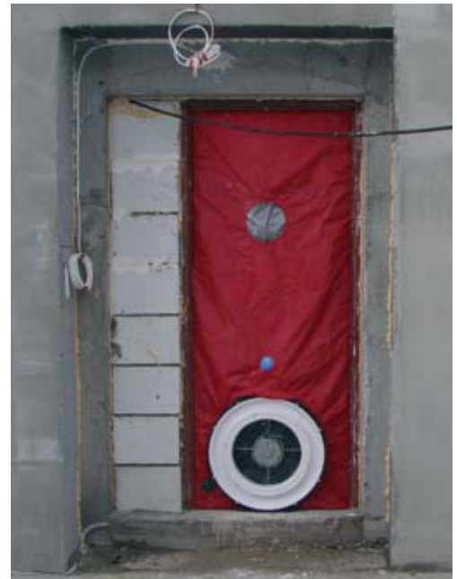
Fot. 2. Urządzenie Blowerdoor zamontowane w drzwiach. Próba na nadciśnienie – blendy od strony zewnętrznej

Po zamontowaniu urządzenia Blowerdoor w drzwiach, przyłączeniu wszystkich kabli oraz przewodów w konfiguracji do badania na nadciśnienie oraz upewnieniu się, że wszystkie okna są zamknięte przystąpiliśmy do wykonywania próby (fot. 3). Po uruchomieniu programu Tectite Express, który steruje działaniem urządzenia Blowerdoor, należy wprowadzić do niego ta-