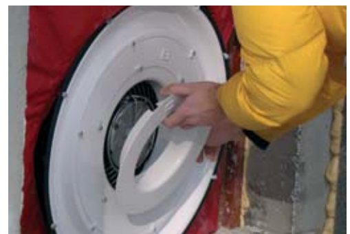
Fot. 4. Instalowanie blendy na wentylatorze urządzenia Blowerdoor